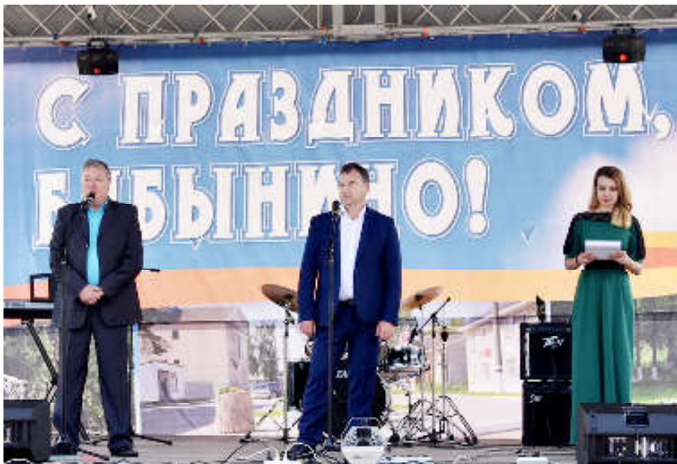
Материалы подготовил С. ТЕЛИЧЕВ